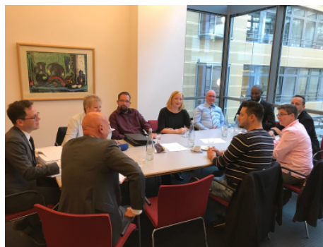
Verhandlungskommission des dbb

Wir haben drei weitere Verhandlungsrunden bis zum Jahresende vereinbart.